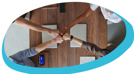
TRABALHO DE EQUIPA

São necessários programas para melhorar competências básicas tais como numeracia e literacia, mas com foco no desenvolvimento de competências transversais, que se destinam a ser competências transferíveis que todos têm e utilizam, tais como: