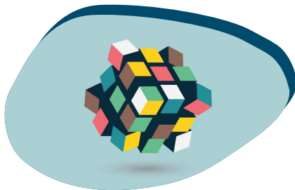
RESOLUÇÃO DE PROBLEMAS

À medida que se torna cada vez mais difícil prever quais serão as competências técnicas do futuro, tanto as competências básicas como as transversais desempenham um papel crucial na reativação e (re)entrada de potenciais alunos de grupos vulneráveis, tanto como cidadãos como como profissionais.