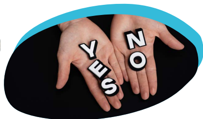
TOMADA DE DECISÕES